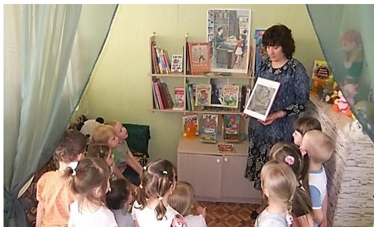
Ребята посетили поселковую библиотеку.