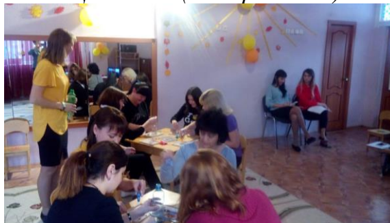
«Цепочка» (со скрепками)