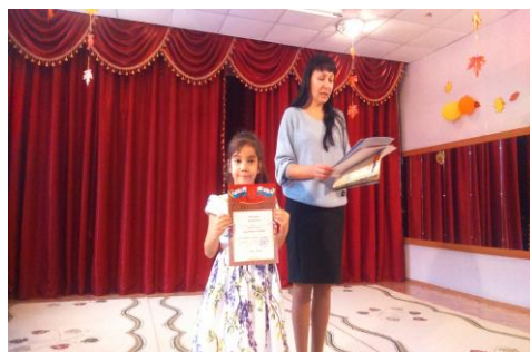
Грамота за III место в конкурсе