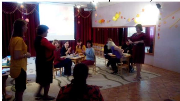
«Лыжники» (с пробками)