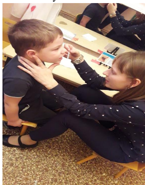
Данные занятия проходили в игровой форме.