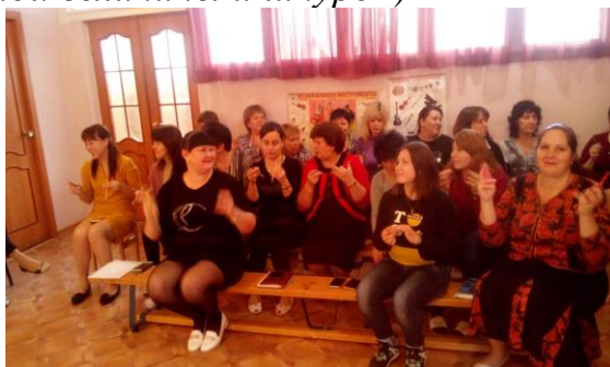
«Передай другому» (карандаш)