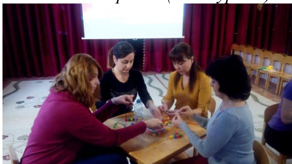
«Кто быстрее?» (со шнурком)