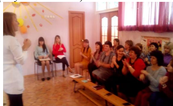
Самомассаж (мячики разного диаметра)