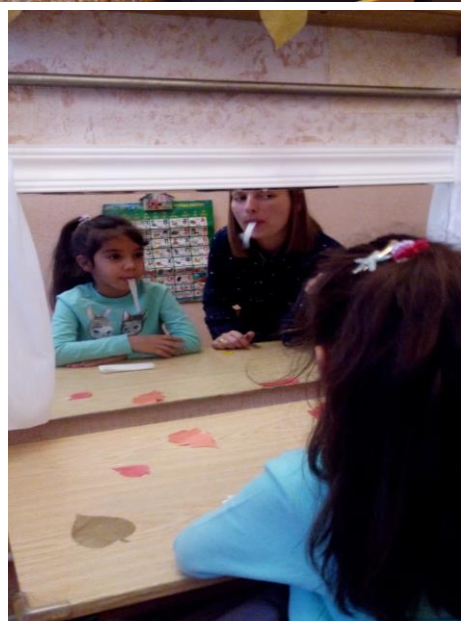
Механическая постановка звука.