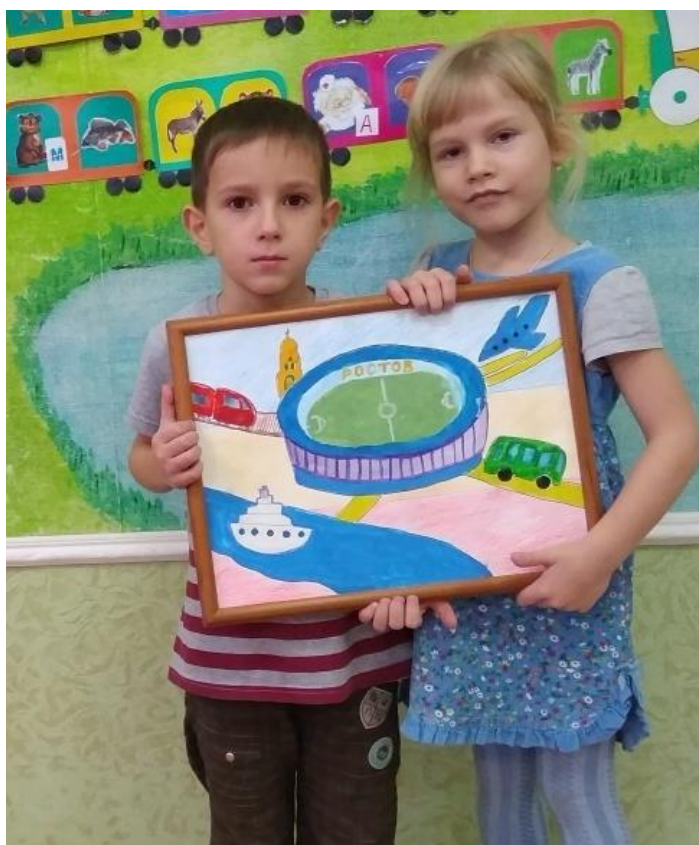
Коллективная работа «Стадион РОСТОВ-Арена»