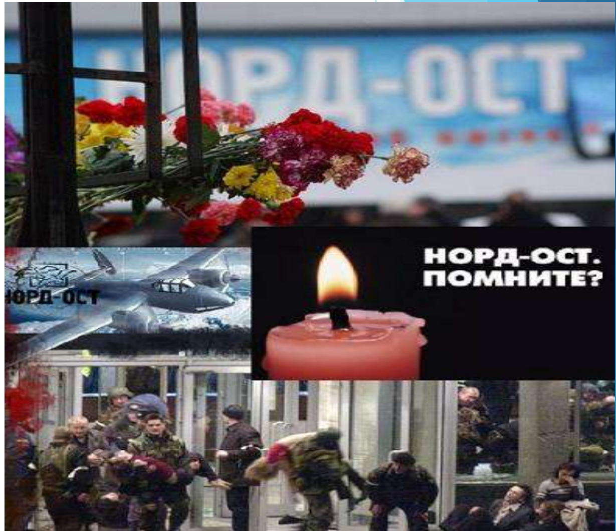
Захват около 800 заложников во время демонстрации популярного мюзикла «Норд-Ост» в Москве в октябре 2002г