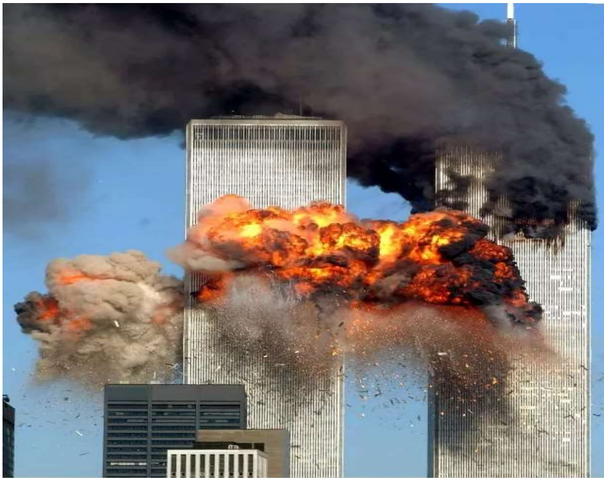
Атака захваченных террористами самолетов башен Всемирного торгового центра в Нью-Йорке и здания Пентагона в Вашингтоне 11 сентября 2001г