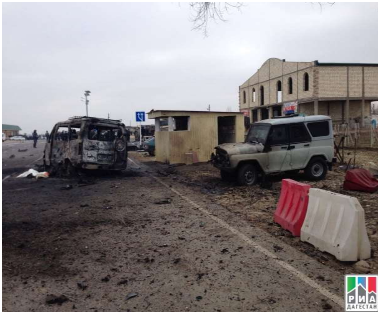
15 февраля 2016г. взрыв на посту ДПС в Дербентском районе Дагестана.