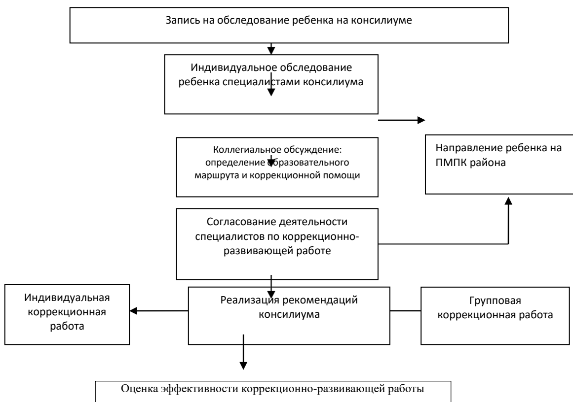
СХЕМА ПСИХОЛОГО-ПЕДАГОГИЧЕСКОЙ КОНСИЛИУМА