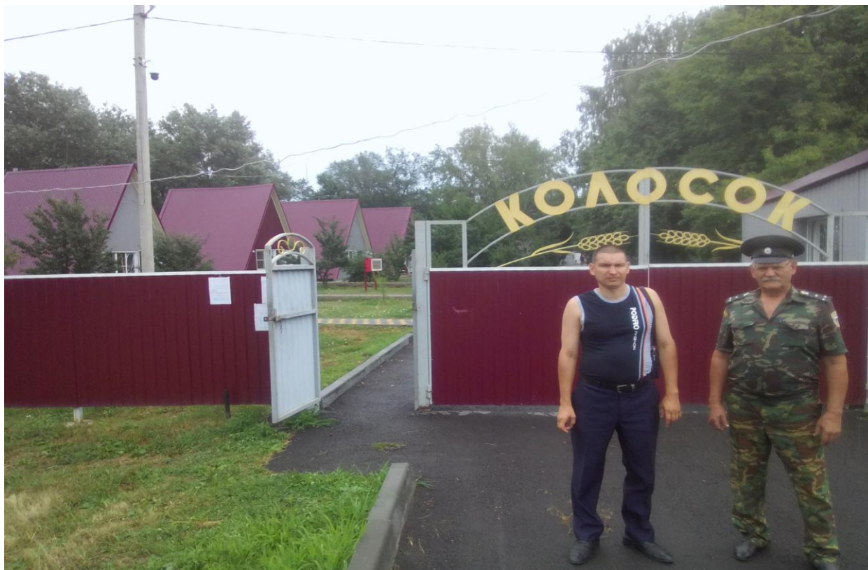
Фото № 3 Детский лагерь отдыха «Колосок» в х. Вислогузов Боковского района Ростовской области спортивная площадка, где проходит тренировка группы «Каратэ».