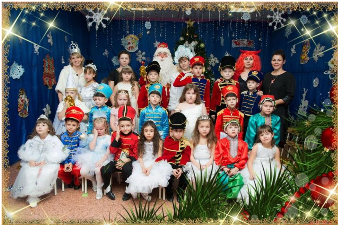
29.12.2016 г. – во всех группах дошкольного возраста.