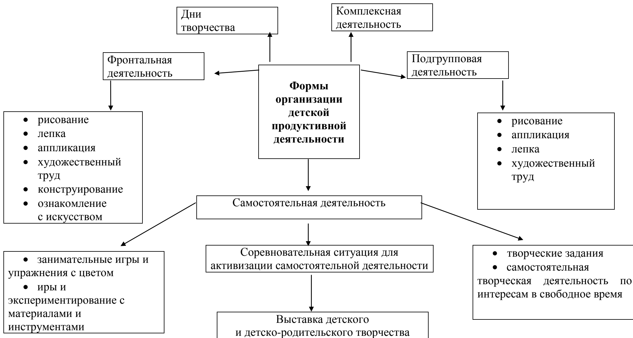
Схема форм организации детской продуктивной деятельности