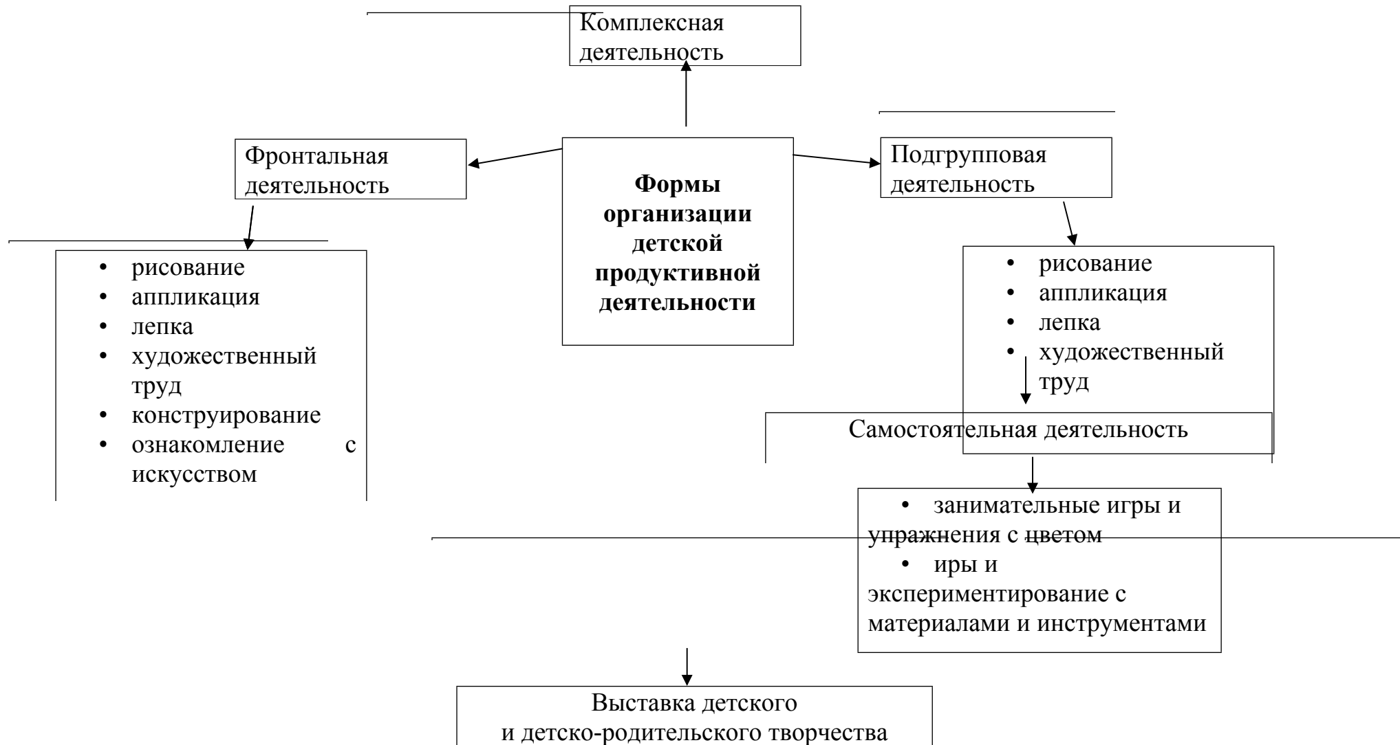
Схема форм организации детской продуктивной деятельности