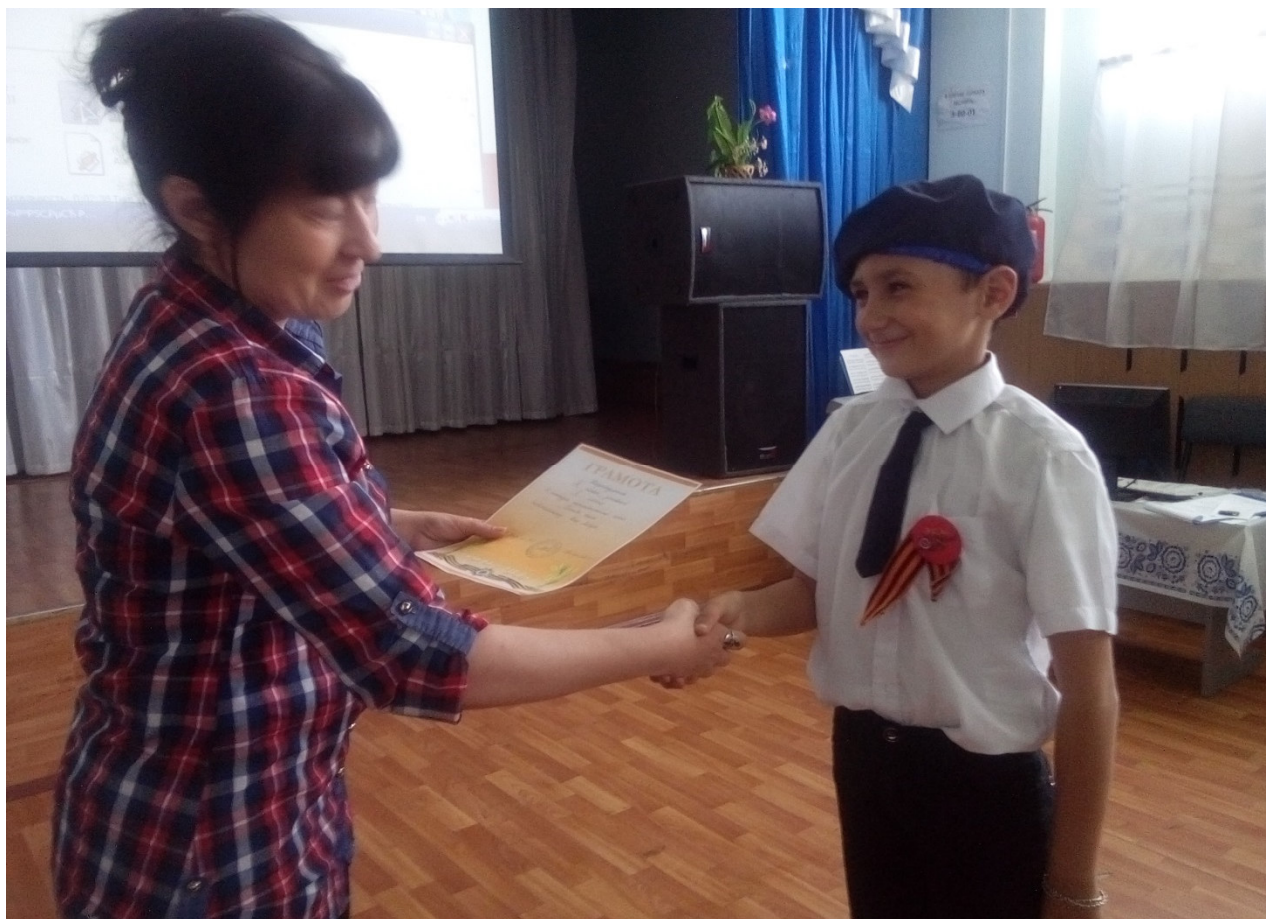
Классный час «Есть такая профессия, Родину защищать»