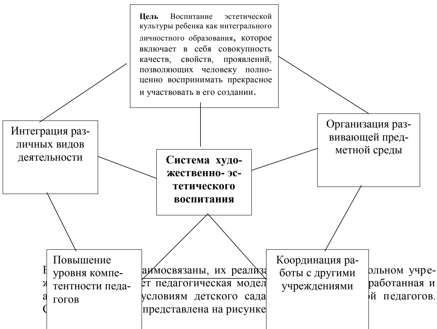
Рисунок 2. Структурная модель системы «Интеграция»