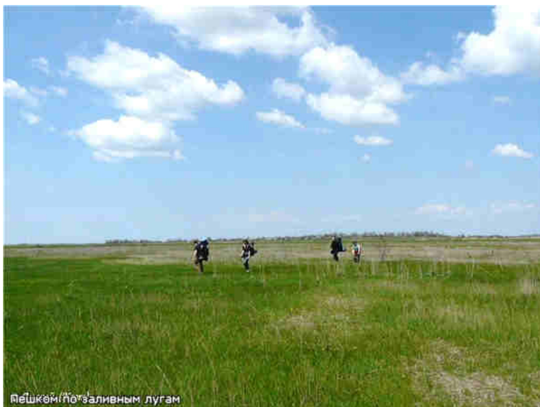
Пешково по заливному лугом

Преодолев же их, попадаешь на широкую насыпь, по которой в прежние времена шла дорога, соединяющая два других села в кагальницкой пойме – Головатовку и Пешково. Головатовка останется за болотистым лугом, по правую руку, а Пешково уже виднеется впереди. Но чтобы ступить на крайнюю сельскую улицу еще не раз придется снять обувь и прошлепать босиком по неглубоким лужам. На пути попадет стадо беззаботных коров, возглавляемых пастухом на коне, но они безразлично пройдут мимо, не потревожа путника.