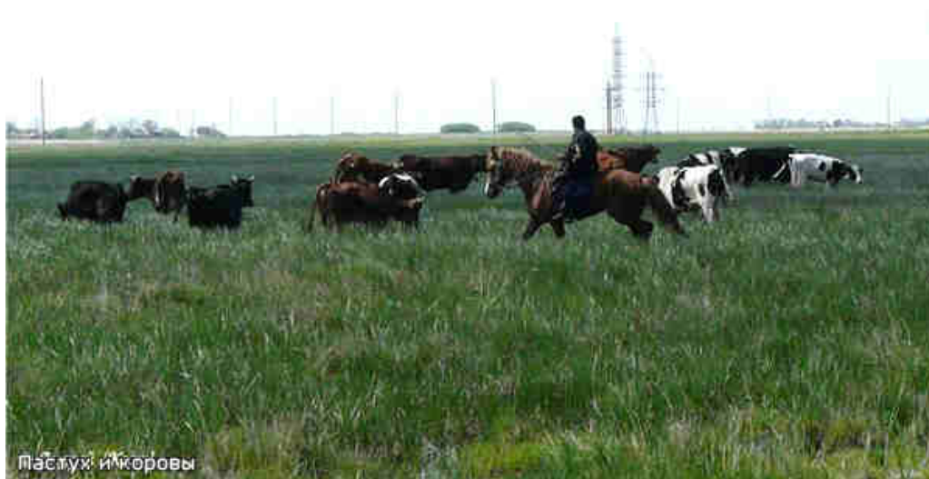
Пастух и коровы

Преодолев же их, попадаешь на широкую насыпь, по которой в прежние времена шла дорога, соединяющая два других села в кагальницкой пойме – Головатовку и Пешково. Головатовка останется за болотистым лугом, по правую руку, а Пешково уже виднеется впереди. Но чтобы ступить на крайнюю сельскую улицу еще не раз придется снять обувь и прошлепать босиком по неглубоким лужам. На пути попадет стадо беззаботных коров, возглавляемых пастухом на коне, но они безразлично пройдут мимо, не потревожа путника.