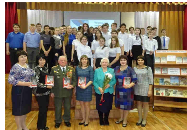
Участники читательской конференции по книгам «Незабываемые годы. 1941-1945»