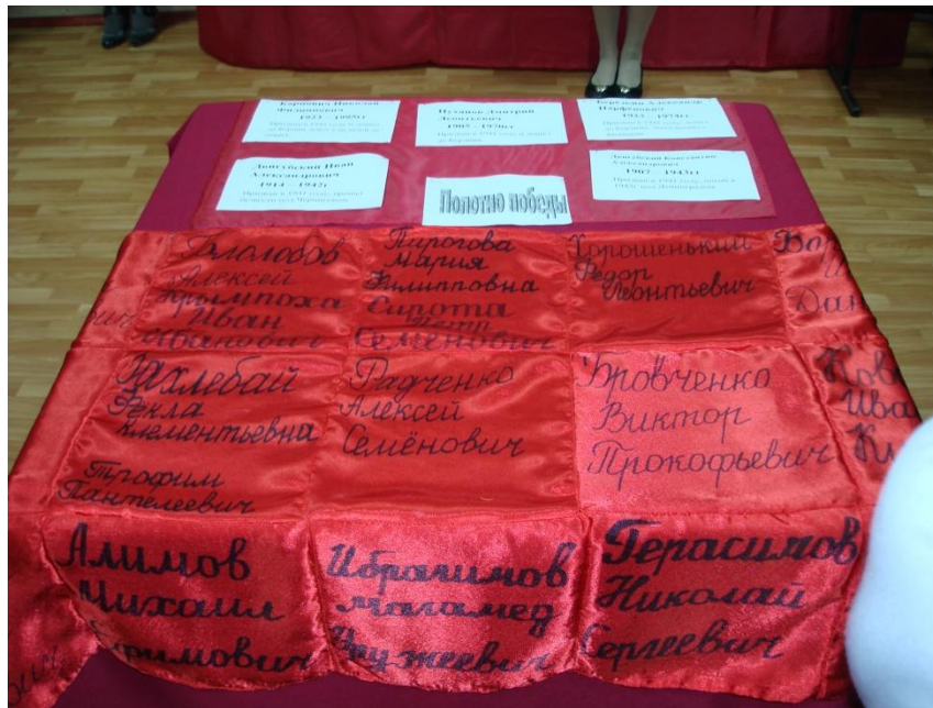
Акция «Полотно Победы».