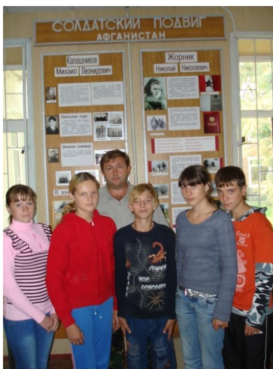
Урок ОБЖ на тему «Патриотизм и верность воинскому долгу- качества защитника Отечества».