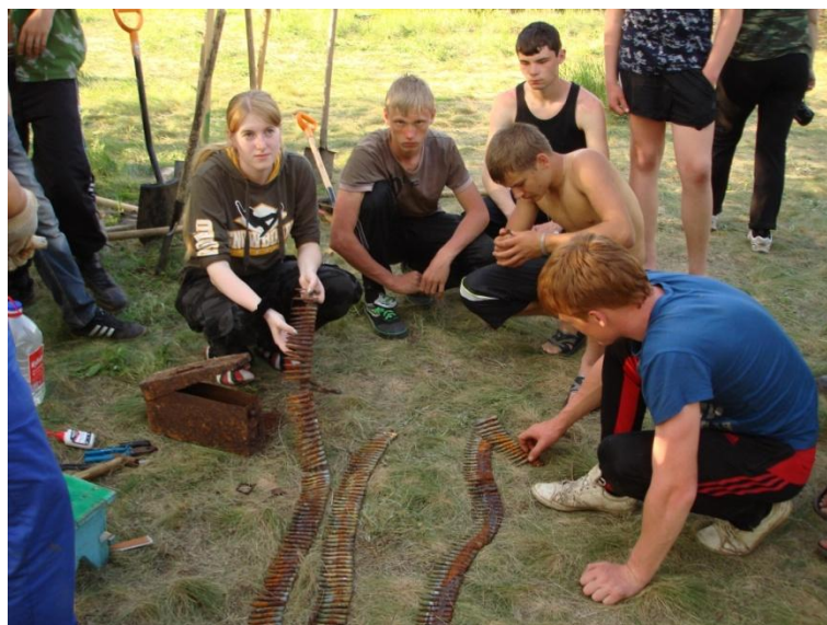
Работа поискового отряда в Куйбышевском районе Ростовской области. Подготовка найденных на Миусском направлении экспонатов к будущей экспозиции в Зале Боевой Славы.