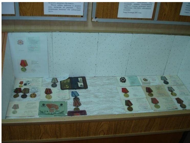
Переданные в дар музею награды ветеранов ВОВ.