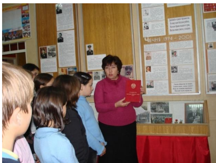
Экскурсия «Современные военные награды»