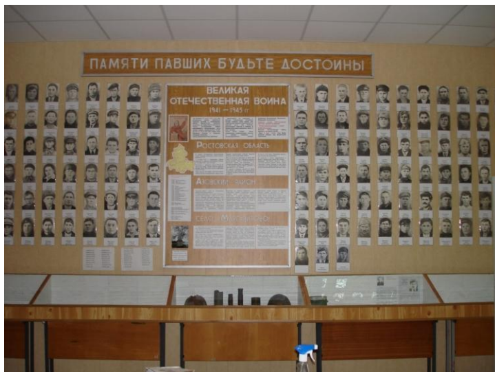
Главная экспозиция .

Экспозиции Зала Боевой Славы историко – краеведческого музея МБОУ Маргаритовской СОШ Азовского района.