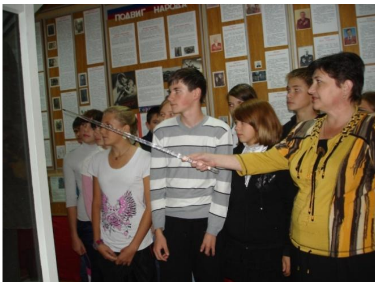
Урок Мужества .