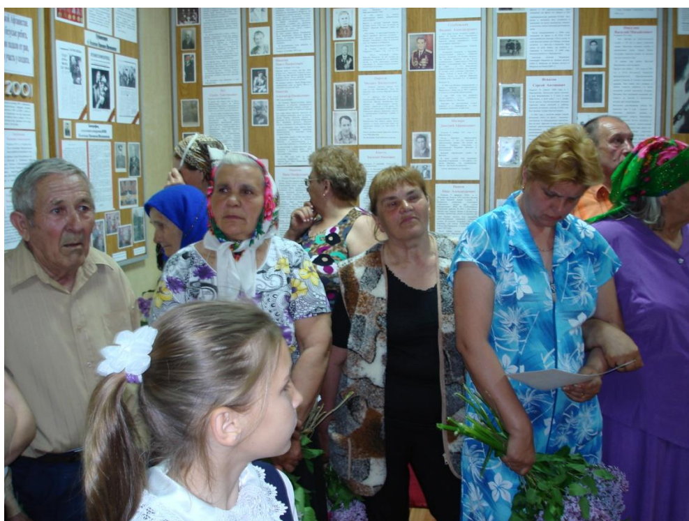
Экскурсия 9 мая для односельчан.