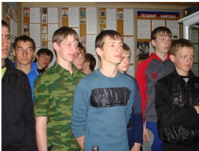
Отряд допризывников Азовского района на экскурсии в школьном музее Маргаритовской СОШ.