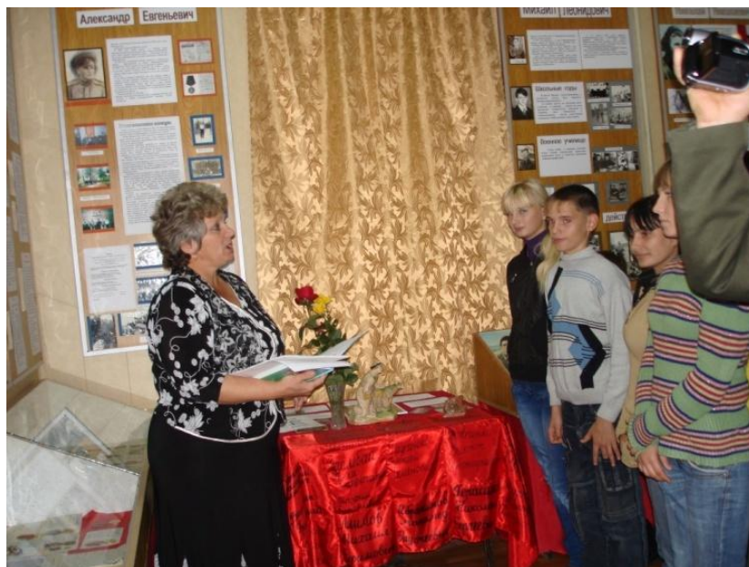
Урок истории- экскурсия на тему «Начало ВОВ».