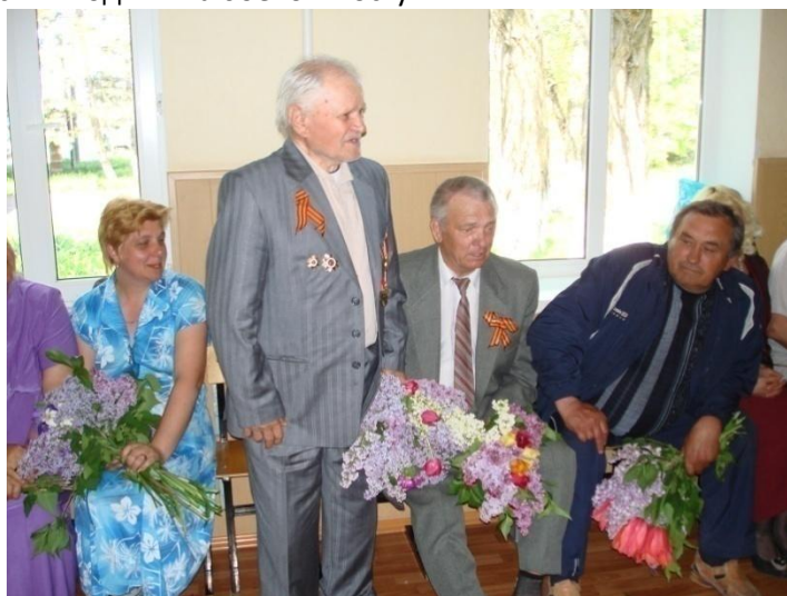
Встреча с ветеранами ВОВ и детьми войны.