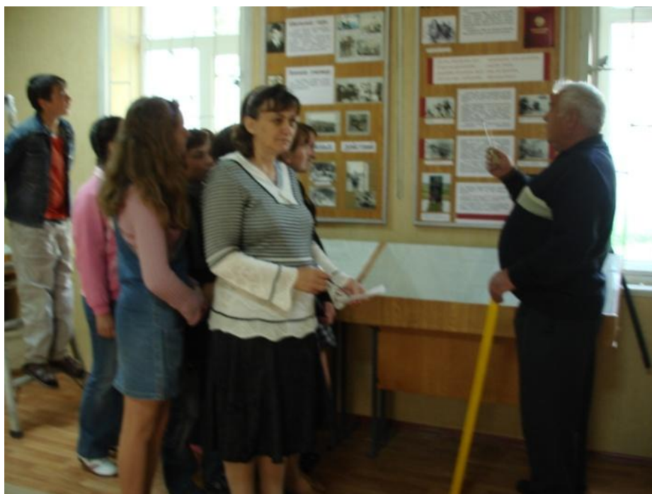
Подготовка к новой экскурсии.