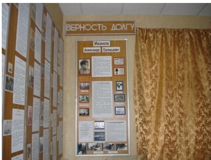
Экспозиция «Верность долгу» посвящена подвигу пограничника, совершившему воинский подвиг на боевом посту.