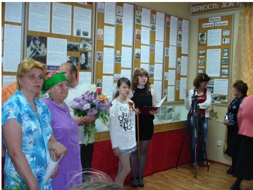
Урок Мужества в музее 9 Мая.