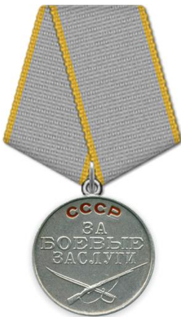
Орден «За боевые заслуги» 2-й степени

«за то, что на плацдарме западного берега реки Висла, находясь в составе расчета, 8 августа 1944 года при отражении контратак сил пехоты и танков противника уничтожил 1 танк, 1 бронетранспортер, 3 пулемета, рассеял и частью уничтожил до двух отделений автоматчиков противника». Мой дедушка был награжден орденом «За боевые заслуги» 2-й степени: «...за то, что в бою за село Дмитриевка под сильным пулеметно-минометным огнем, презирая смерть, шесть раз восстановил линию связи». Об этом я прочитал вместе с родителями на сайте «Подвиг народа».