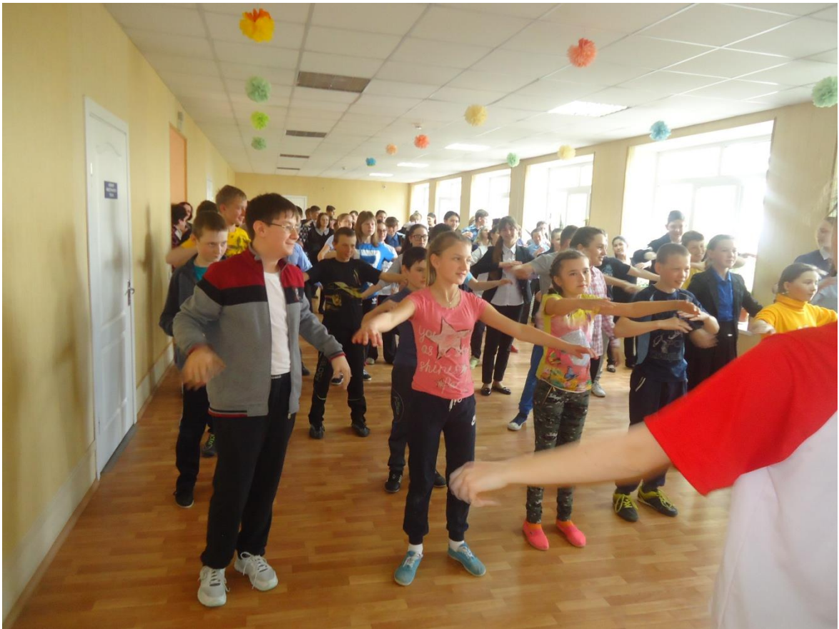
2. Общешкольная линейка «День Здоровья». 1-4 класс