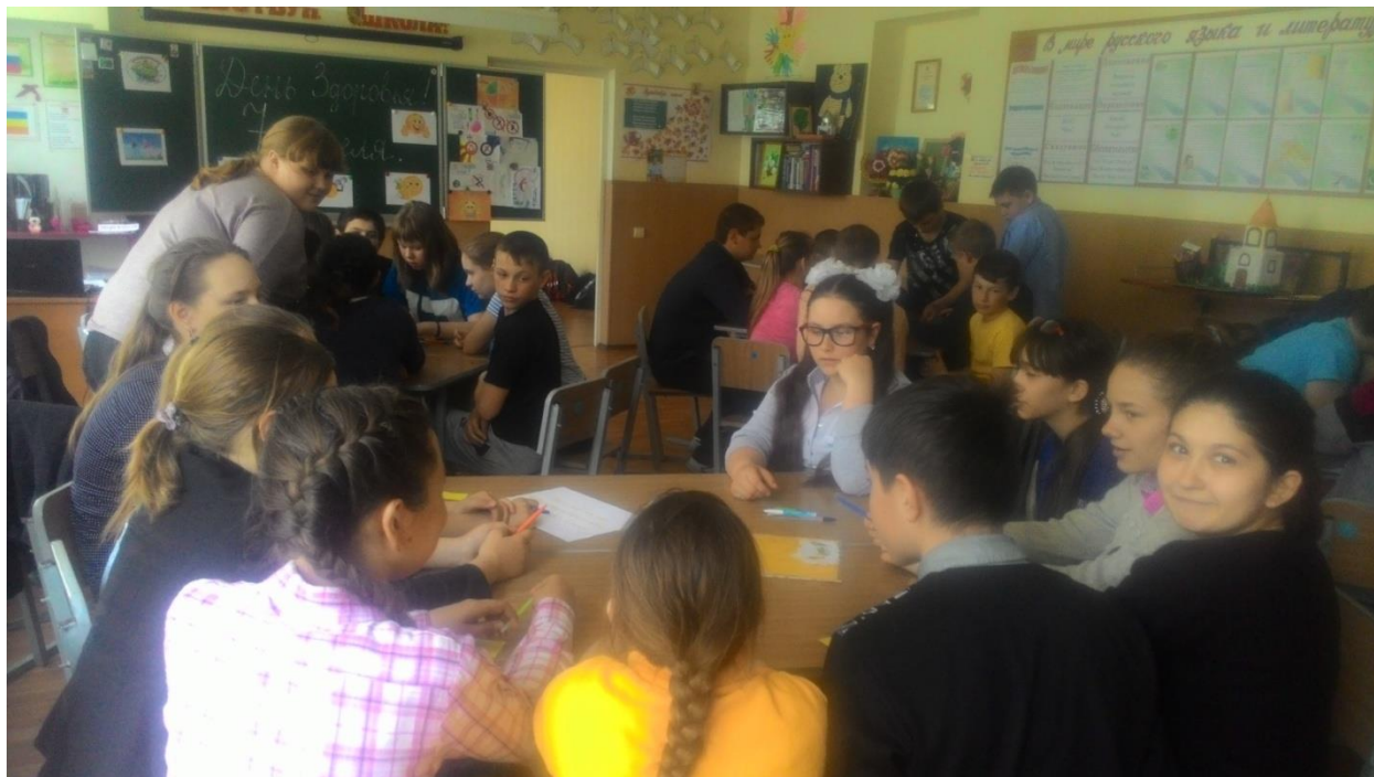
8 – 9 класс