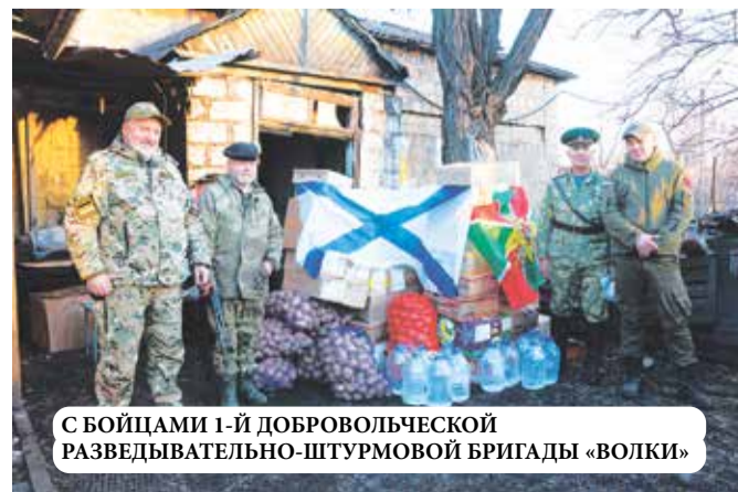
С БОЙЦАМИ 1-Й ДОБРОВОЛЬЧЕСКОЙ РАЗВЕДЫВАТЕЛЬНО-ШТУРМОВОЙ БРИГАДЫ «ВОЛКИ»

О нашем пребывании на Донбассе читайте на 6 и 7 страницах.