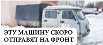
ЭТУ МАШИНУ СКОРО ОТПРАВЯТ НА ФРОНТ