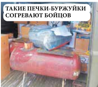
ТАКИЕ ПЕЧКИ-БУРЖУЙКИ СОГРЕВАЮТ БОЙЦОВ