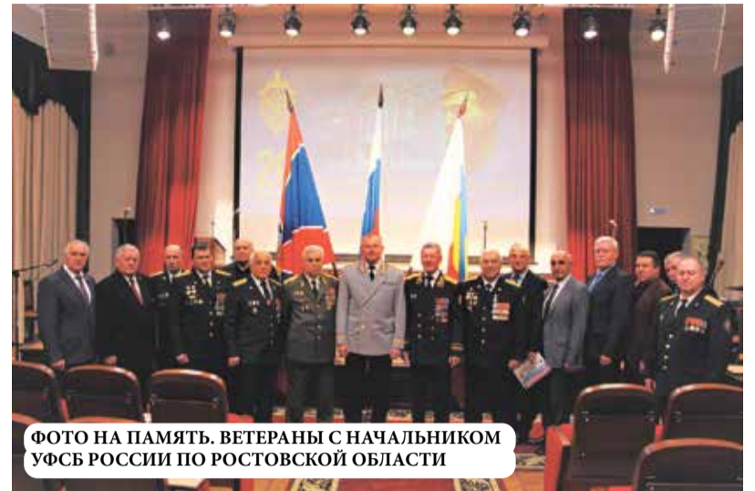
ФОТО НА ПАМЯТЬ. ВЕТЕРАНЫ С НАЧАЛЬНИКОМ УФСБ РОССИИ ПО РОСТОВСКОЙ ОБЛАСТИ