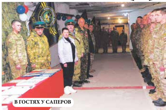
В ГОСТЯХ У САПЕРОВ

26 декабря прошлого года и 21 января нынешнего года нам удалось каждый раз побывать сразу в двух регионах Донбасса - Донецкой и Луганской Народных Республиках.