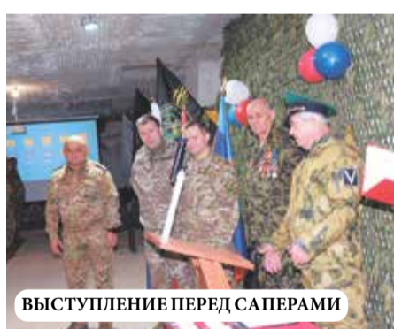
ВЫСТУПЛЕНИЕ ПЕРЕД САПЕРАМИ