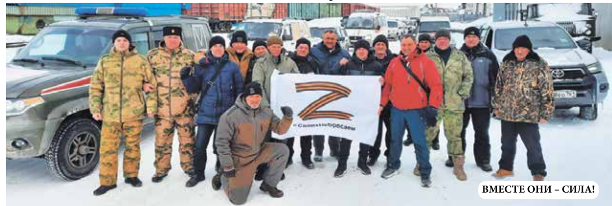
ВМЕСТЕ ОНИ – СИЛА!