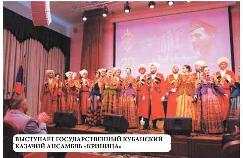
ВЫСТУПАЕТ ГОСУДАРСТВЕННЫЙ КУБАНСКИЙ КАЗАЧИЙ АНСАМБЛЬ «КРИНИЦА»