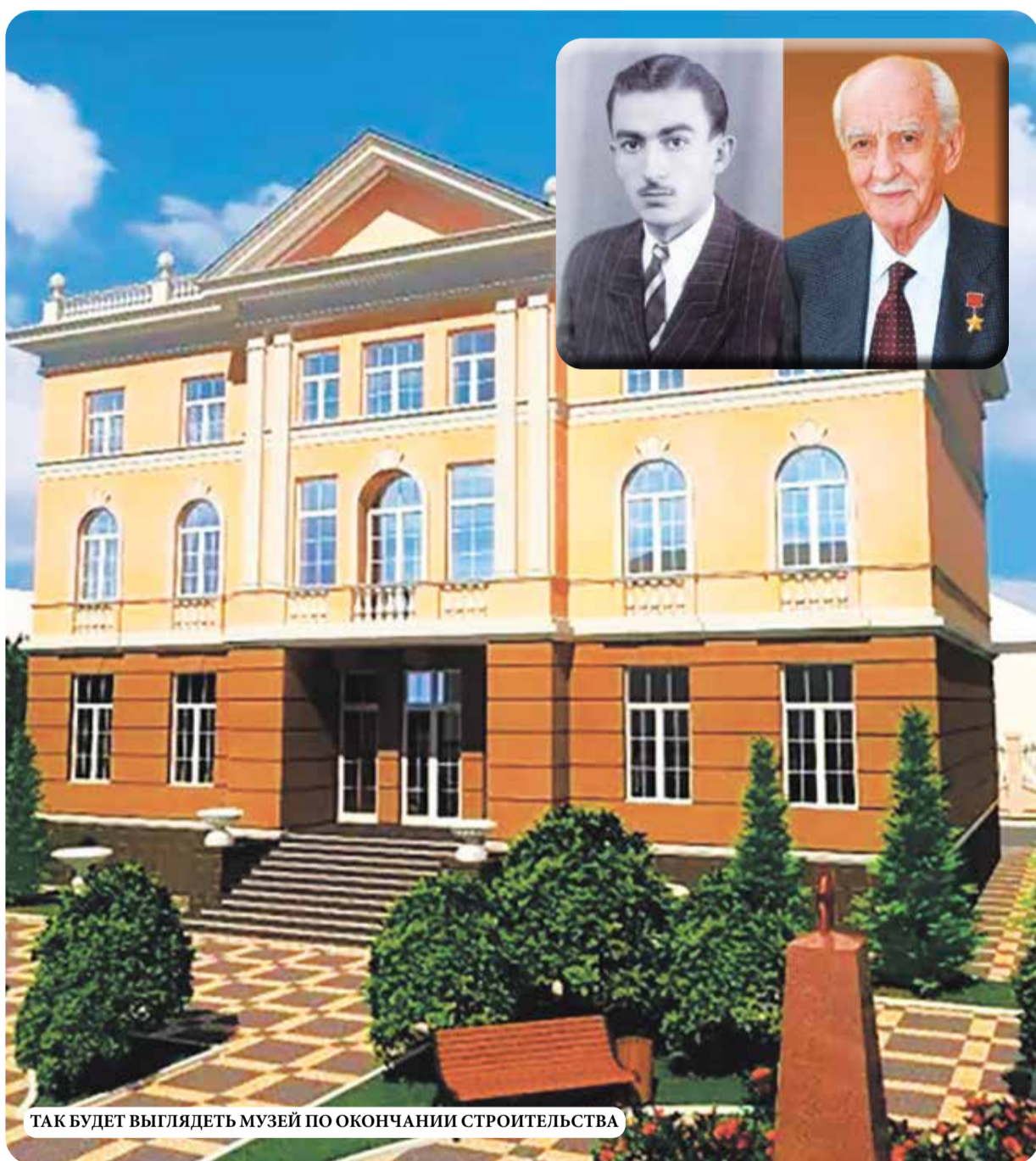
ТАК БУДЕТ ВЫГЛЯДЕТЬ МУЗЕЙ ПО ОКОНЧАНИИ СТРОИТЕЛЬСТВА