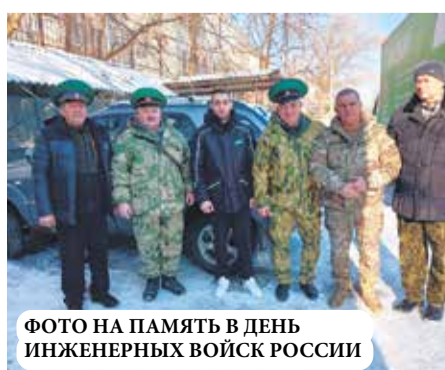
ФОТО НА ПАМЯТЬ В ДЕНЬ ИНЖЕНЕРНЫХ ВОЙСК РОССИИ

Поездки в зону СВО, это всегда, не прогулки под луной с любимой девушкой. Существует опасность попасть под обстрел. Одно дело, когда возем гуманитарку в города, которые уже находятся в тылу и, другое, когда непосредственно в зону ЛБС (линия боевого столкновения) по разбитым в пух и прах, дорогам. Предновогодняя поездка выдалась особенно нервной. Все руководство, по объективным причинам, разъехалось и вся ответственность по сбору, комплектации и доставке легла на меня, военного фоторепортера. Когда едешь с руководством, твоя задача вертеть головой и искать удачные кадры для публикации в газете и фотоотчетах. А тут... Но, не ехать было нельзя. Нас ждали ребята, и мы уже пообещали привезти им подарки к Новому году.