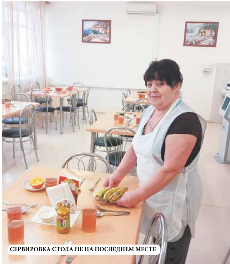
СЕРВИРОВКА СТОЛА НЕ НА ПОСЛЕДНЕМ МЕСТЕ