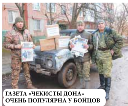
ГАЗЕТА «ЧЕКИСТЫ ДОНА» ОЧЕНЬ ПОПУЛЯРНА У БОЙЦОВ