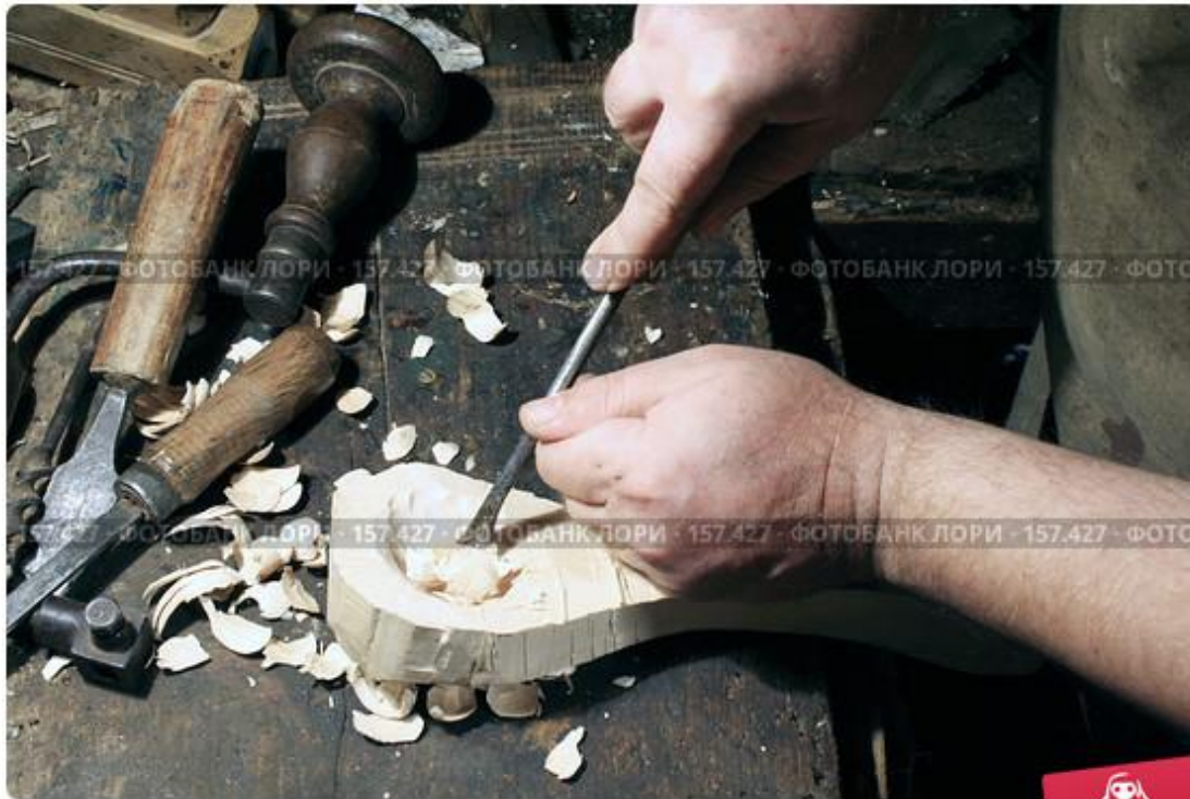
Старинный процесс изготовления деревянной ложки. Выборка углубл

Ложки на Руси делали с выдумкой: расписные, вырезные. Ложки изготавливали специальные мастера, их называли «ложкари, ложечники».