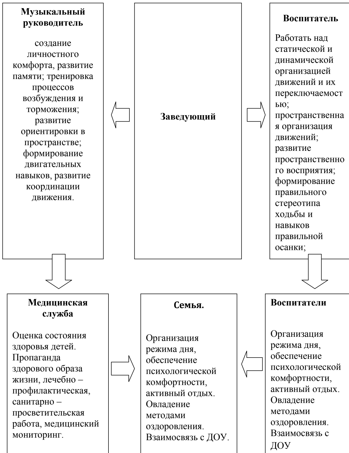
Схема взаимодействия специалистов, воспитателей ДОУ и семьи в организации физкультурно-оздоровительной работы