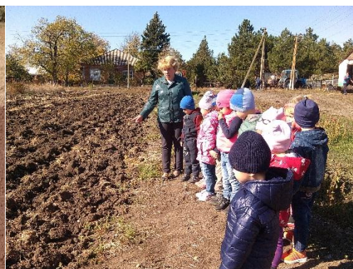
Наблюдали за работой трактористов. Как они пашут и боронуют землю.