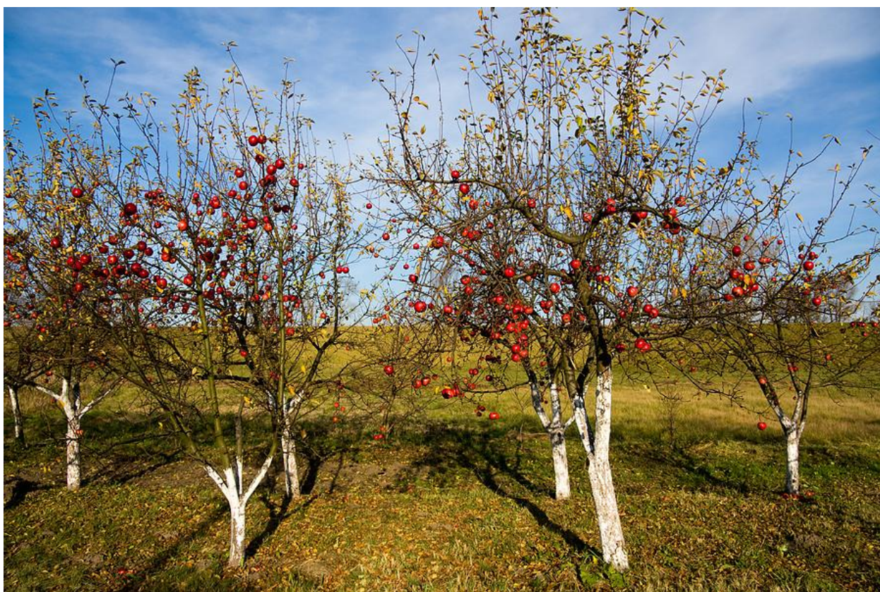
Яблоневый сад в п Каяльский