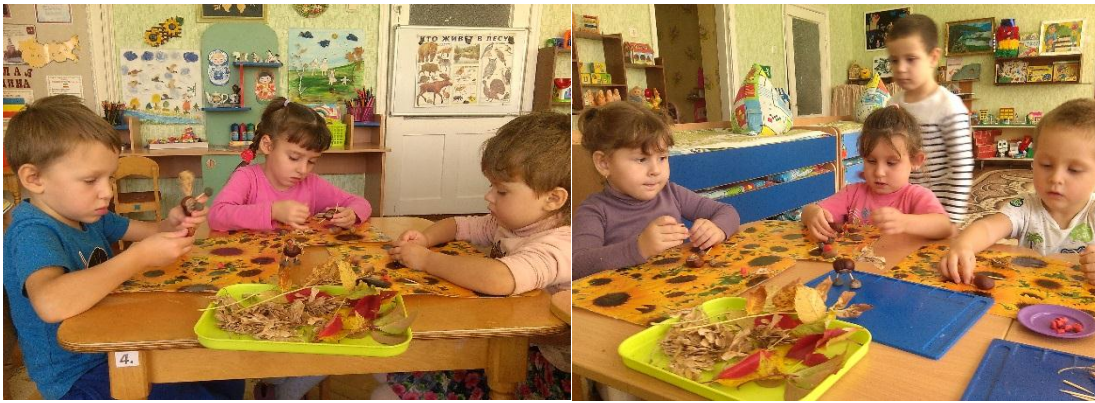
«Какие красивые получились Петушки»