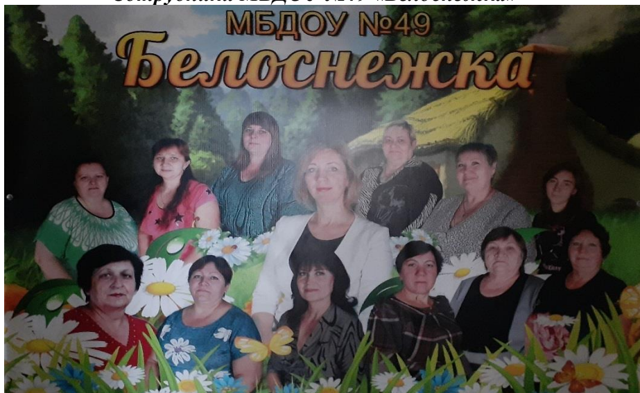
Сотрудники МБДОУ №49 «Белоснежка»

Педагог: Профессия - это труд, которому человек посвящает свою жизнь. Каждому человеку необходимо трудиться, ведь именно труд приносит пользу и делает человека сильным, красивым и трудолюбивым. Ребята каждая работа важна, и каждая профессия связана с какими-то предметами. Сейчас я буду загадывать загадки, вы их будете отгадывать и говорить, что необходимо каждому в своей работе.