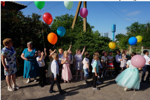
Родители детского сада «Белоснежка» группы «Теремок» Под музыку «Учат в школе» дети выходят на улицу и выпускают воздушные шарики в небо)