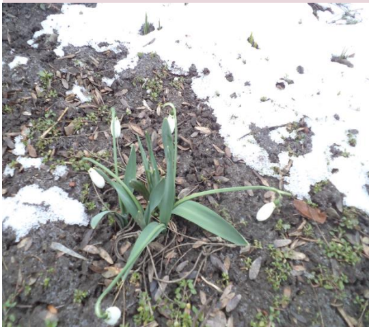
«Подснежник» (первый мартовский цветок)