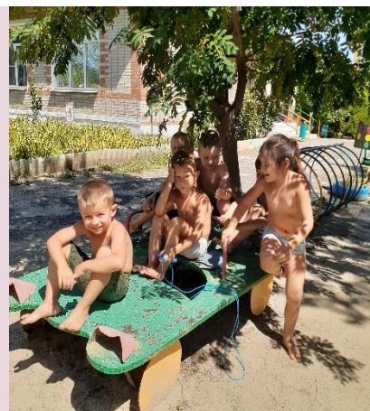
«Мы едим, едим в далекие края»