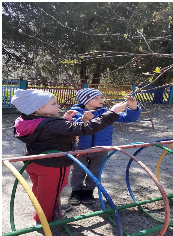
«Рассматривание ветки рябины»