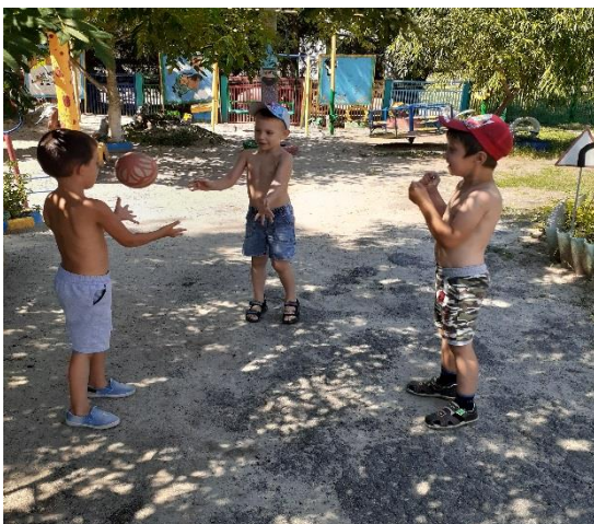
«Съедобное не съедобное»