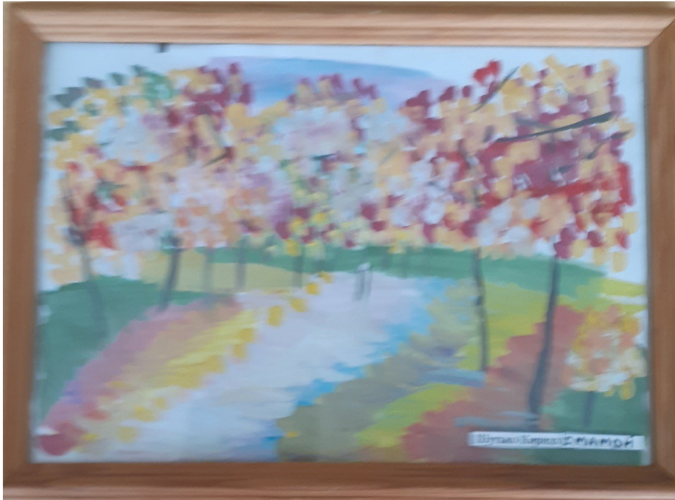
Кирилл Шутько с мамой

Осень на опушке краски разводила По листве тихонько кистью проводила.