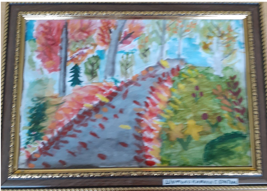
Кирилл Шутько с братом Данилом