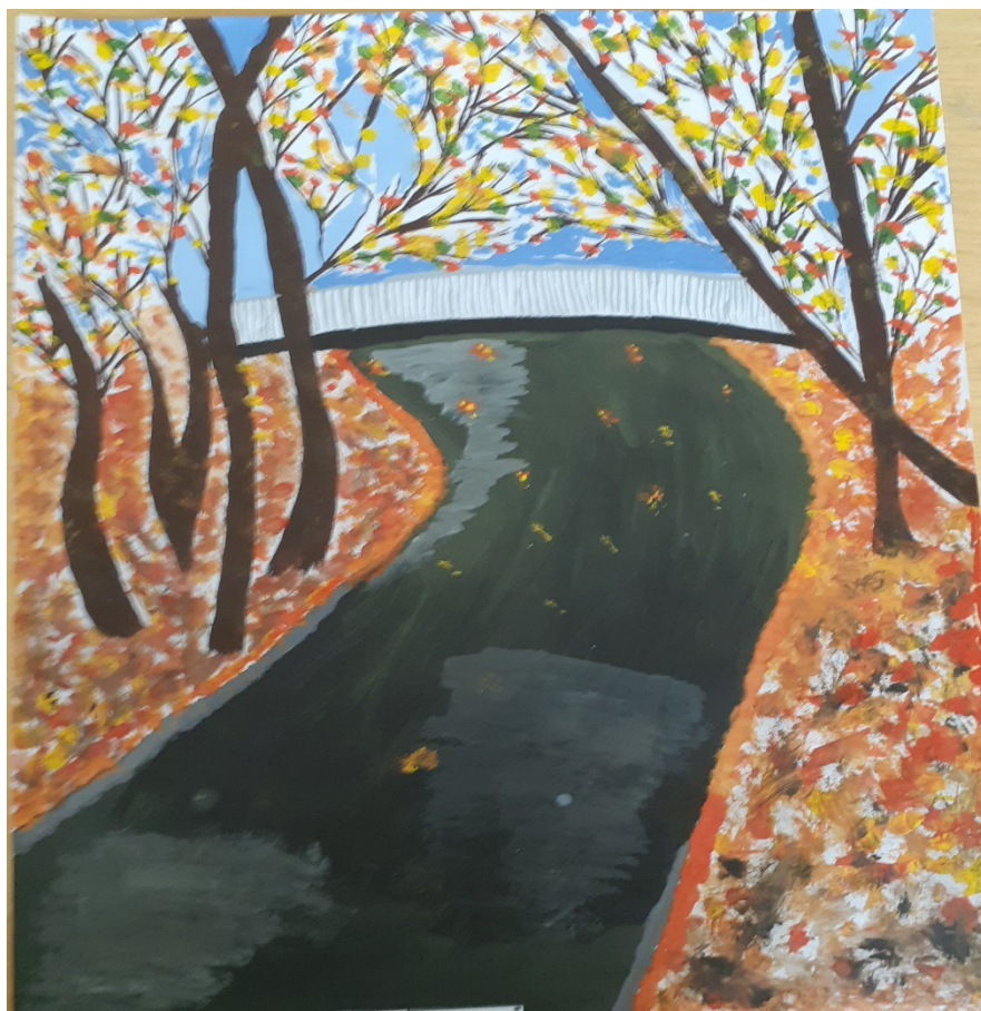
Трипута Евгения с папой.