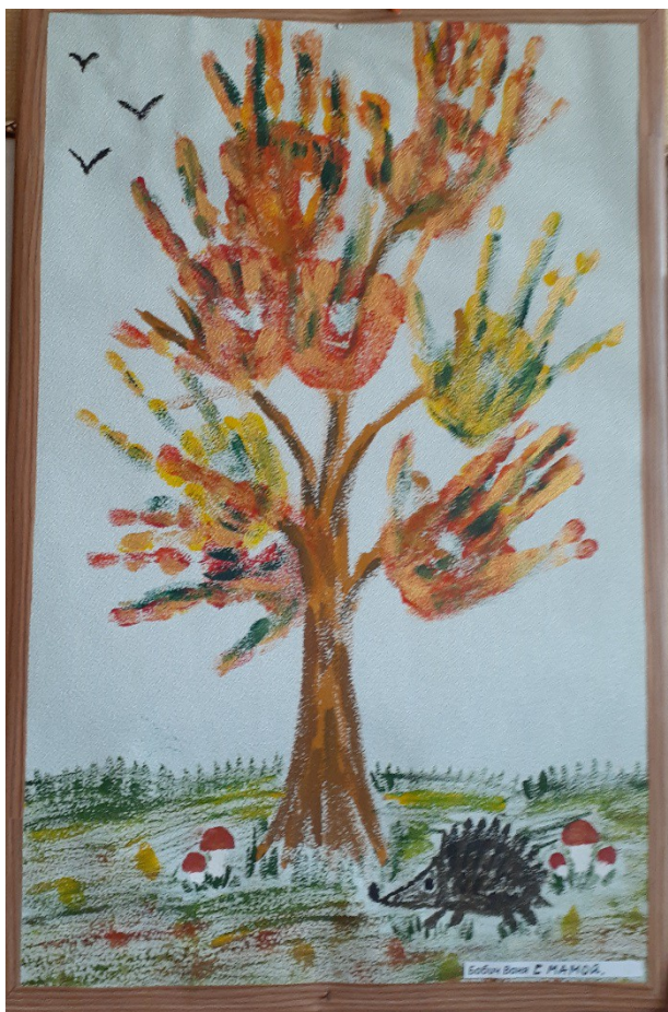
Ваня Бабич с мамой