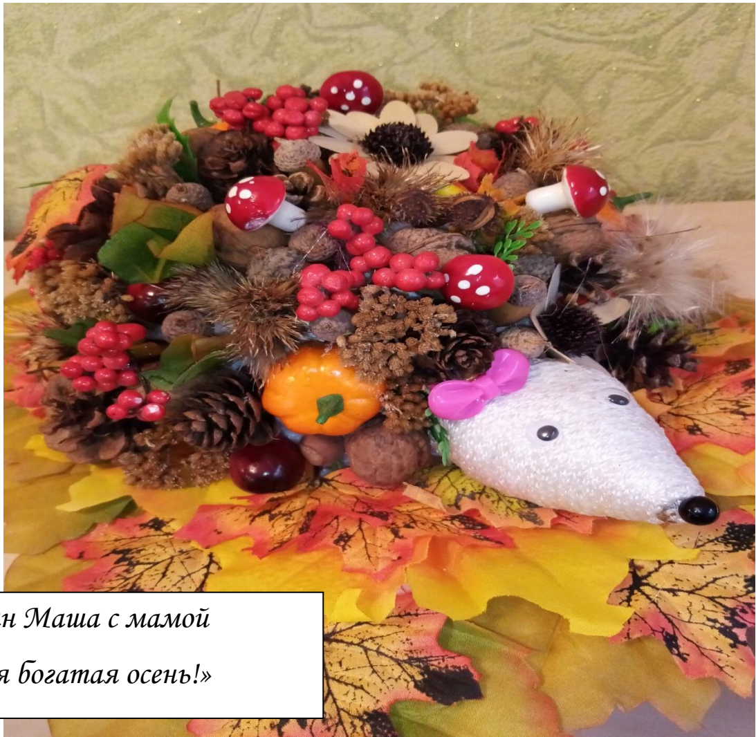
Цурқан Маша с мамой «Какая богатая осень!»