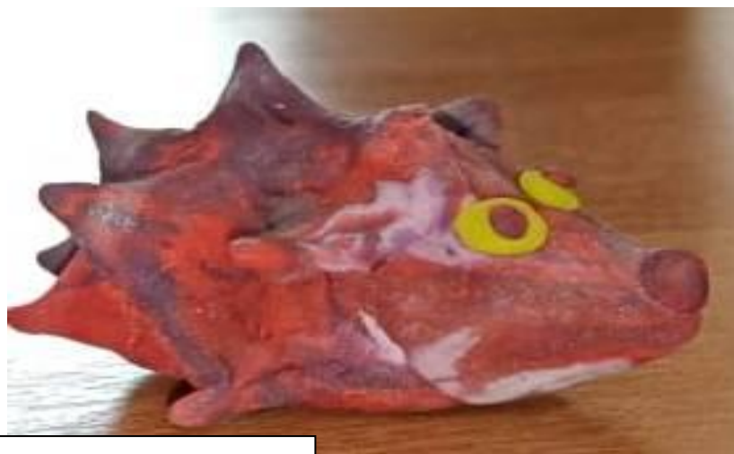
Герасименко Ксюша с мамой «Креативный ёжик»