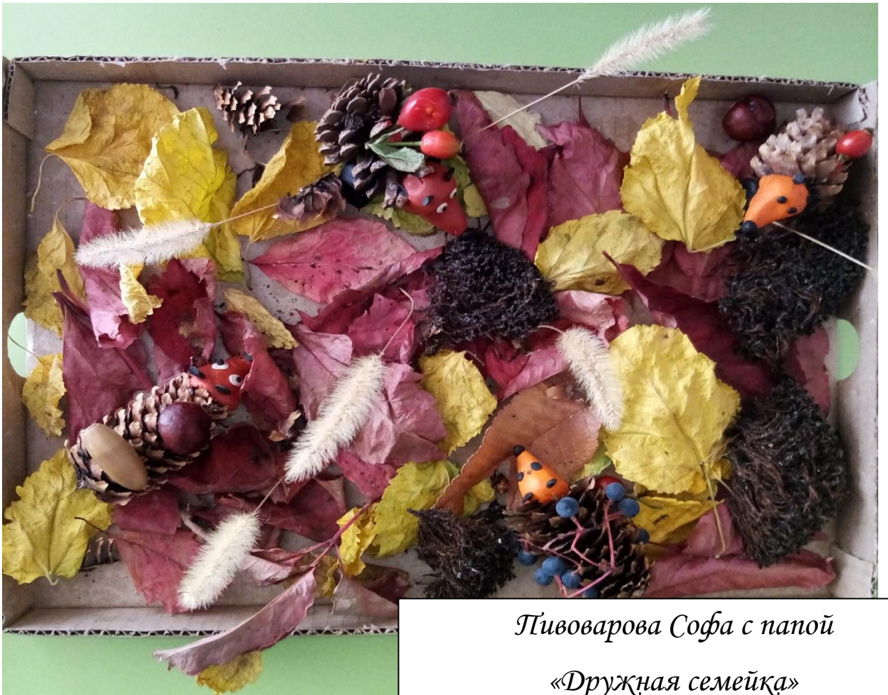
Пивоварова Софа с папой «Дружная семейка»