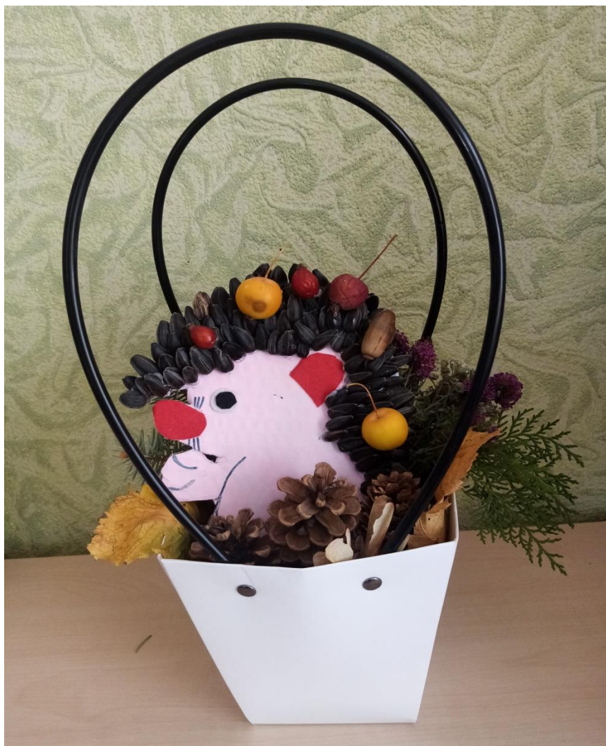
Цурқан Варя с мамой «Самая уютный домик!»