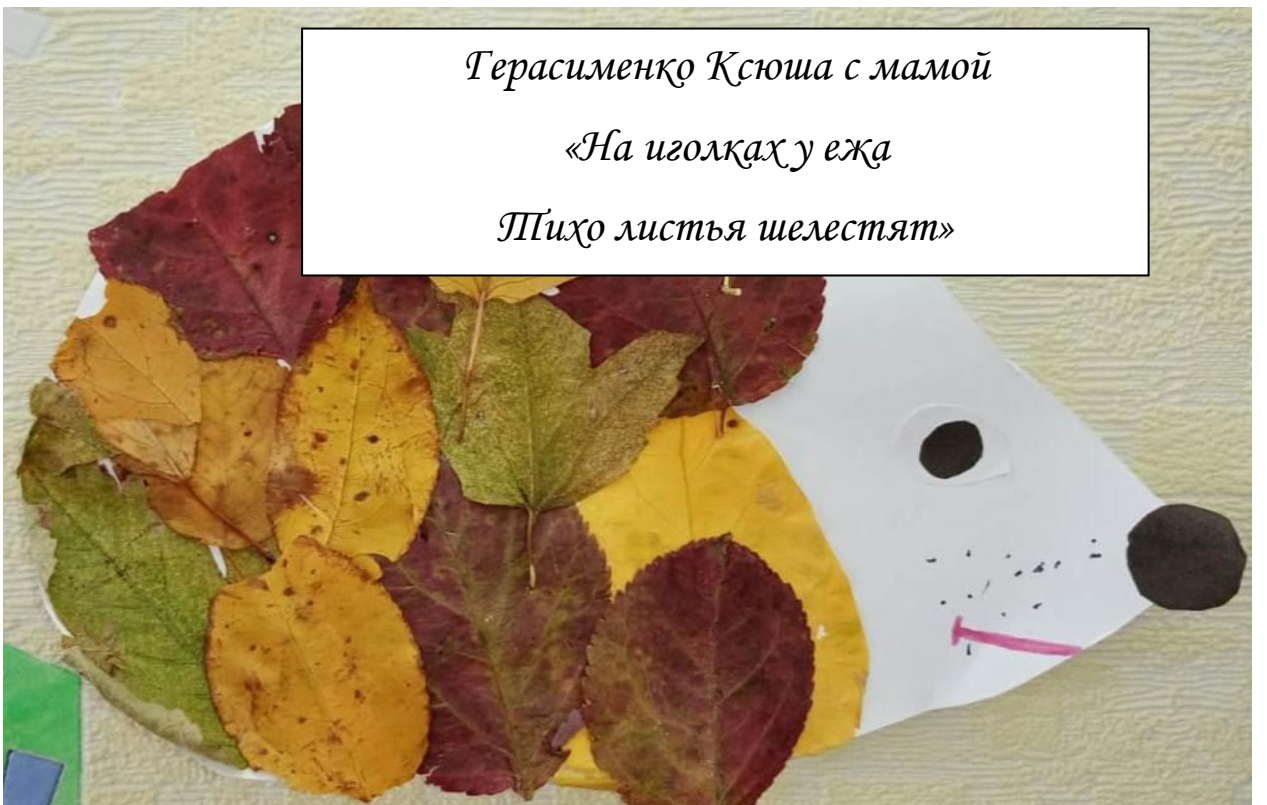
Герасименко Ксюша с мамой «На иголках у ежа Тише листья шелестят»