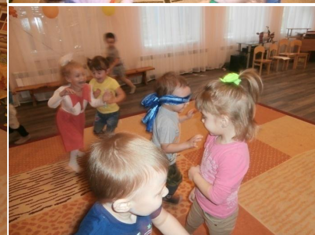
Сюжетно-ролевые игры: «Ежика», «Пикник».