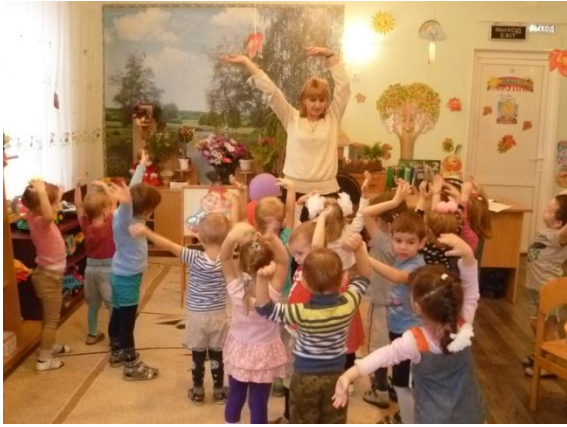
Тема: «Осенние листочки». (Приложение 3)

Цели: Знакомить с характерными особенностями осенних деревьев.