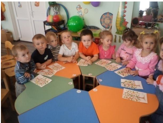
Тема: «Свойства воды». (Приложение 3)

Цель: Познакомить детей с некоторыми свойствами воды в процессе опытно-экспериментальной деятельности.